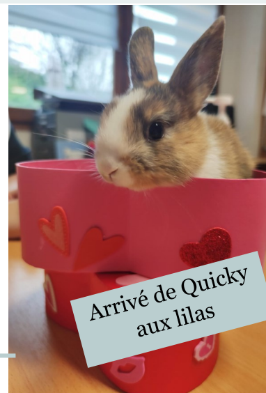
Arrivé de Quicky aux lilas

Nous espérons que vous aurez plaisir à nous lire et à nous suivre et comptons sur votre fidélité!