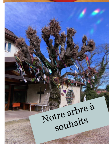
Notre arbre à souhaits